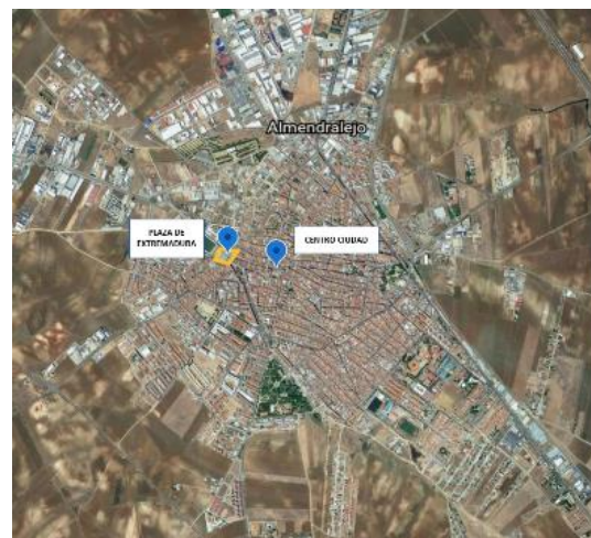
Fig: Situación Plaza Extremadura

El objetivo de la estrategia DUSI correspondiente a esta línea de actuación es la recuperación de forma integral de áreas urbanas degradadas. Las diferentes actuaciones que se han ido sucediendo en la Plaza de Extremadura a lo largo de la historia han provocado que exista una yuxtaposición de elementos urbanos que no invitan a la utilización de este espacio por parte de los habitantes de la ciudad. La actuación descrita contempla la mejora de los espacios urbanos en los siguientes aspectos: