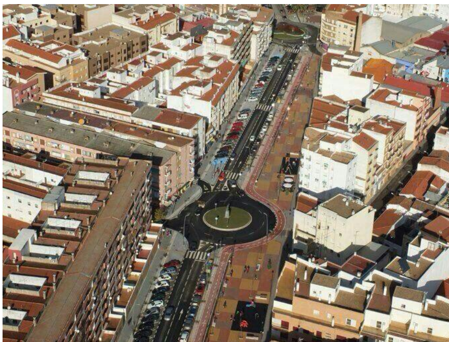
Avenida de la Paz

Un ejemplo de esta estrategia es la transformación del eje formado por la Avenida de la Paz y la Plaza de la Libertad, que fue objeto de una convocatoria anterior de ayudas FEDER.