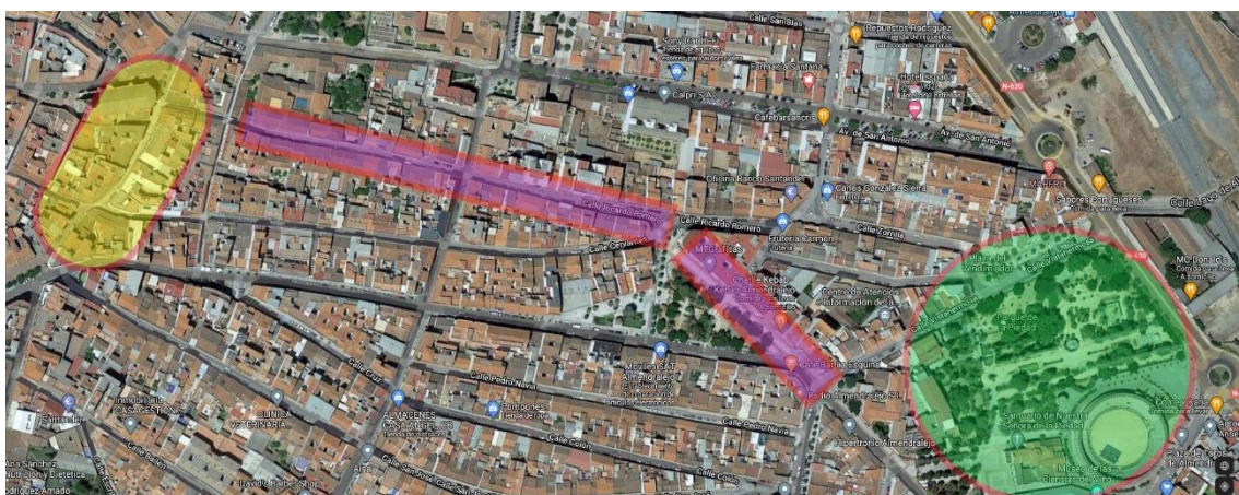
Itinerario peatonal de conexión espacios públicos en el centro urbano

En la misma línea que la expuesta, se pretende potenciar la movilidad peatonal en la zona histórica de Almendralejo a través de la creación de itinerarios peatonales adaptados. Con la actuación proyectada en las obras de peatonalización de la calle Ricardo Romero se busca fomentar la conexión peatonal del entorno de la Calle Real y Plaza de España, con el Parque de la Piedad. De esta forma se pretende mejorar las condiciones de accesibilidad por parte de la ciudadanía a los espacios públicos, fomentando y facilitando la utilización de las dotaciones públicas y espacios verdes del centro de la ciudad.