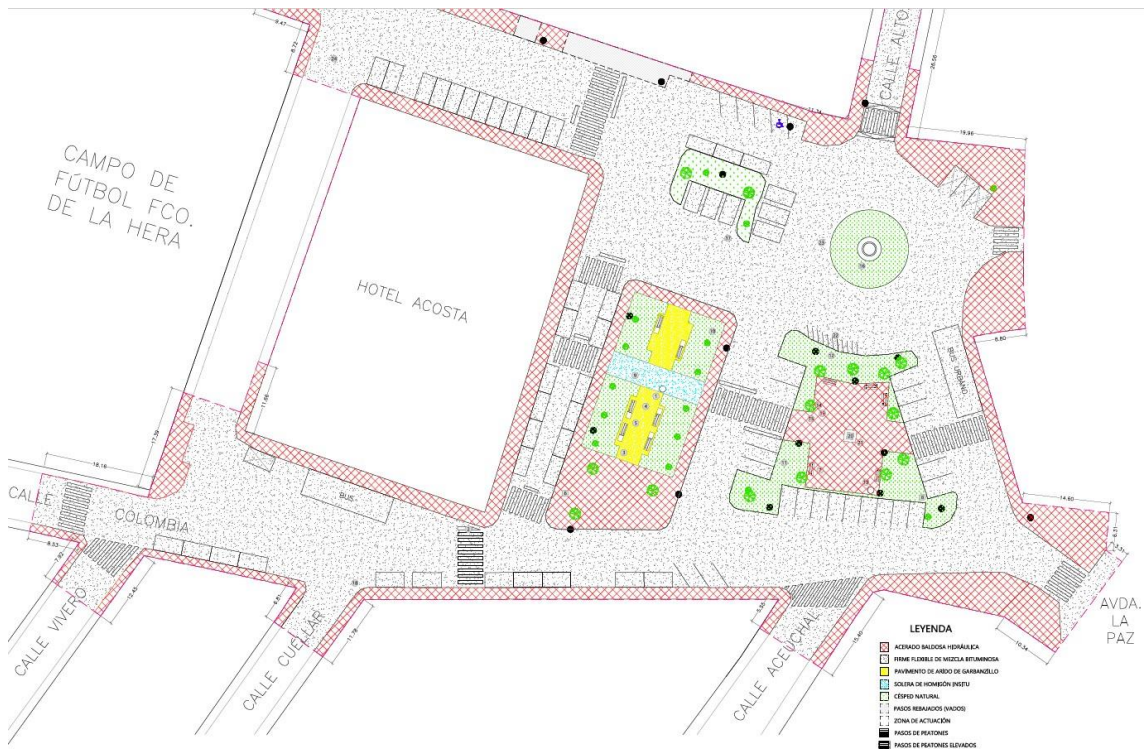
Estado actual entorno Plaza Extremadura

La actuación proyectada en la Plaza de Extremadura pretende continuar con estas actuaciones de recalificación del espacio urbano a fin de generar ámbitos de estancia y relación para la ciudadanía