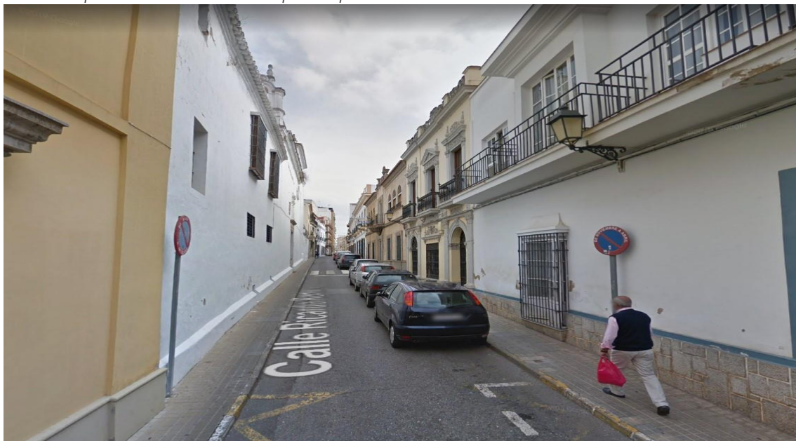
Estado actual calle Ricardo Romero